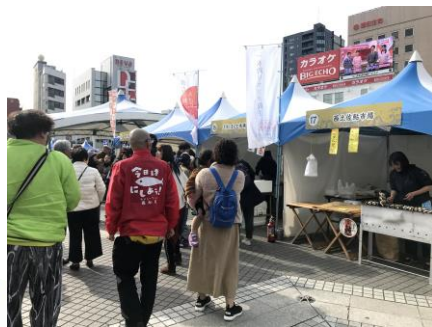
中央公園でのおさかな祭り。焼が間に合わず...

く非常に多くのお客さんでにぎわった。実行委員もどうしたんだと驚いていた。 鮎市場からは、鮎の塩焼きとツガニ汁を販売。ツガニ汁は10時のスタートと共に列ができて30分ほどで完売した。鮎の塩焼きも焼いても焼いても間に合わず、予約販売で完売した。他のお店も行列ができており、好調。非常に気持ちのいいイベントであった。